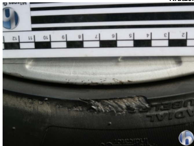
5. Felge (Aluminium) vorne rechts