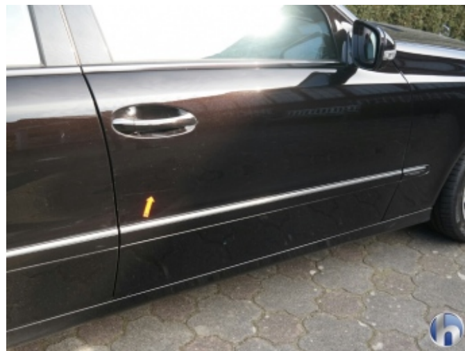
4. Tür Vorne - Rechts