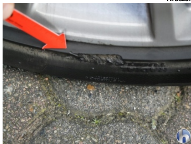
7. Reifen Vorne - Rechts