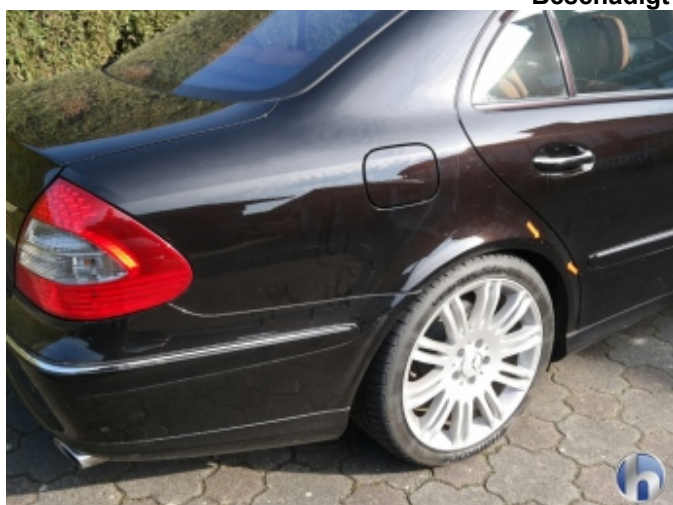
3. Seitenwand - Hinten - Rechts