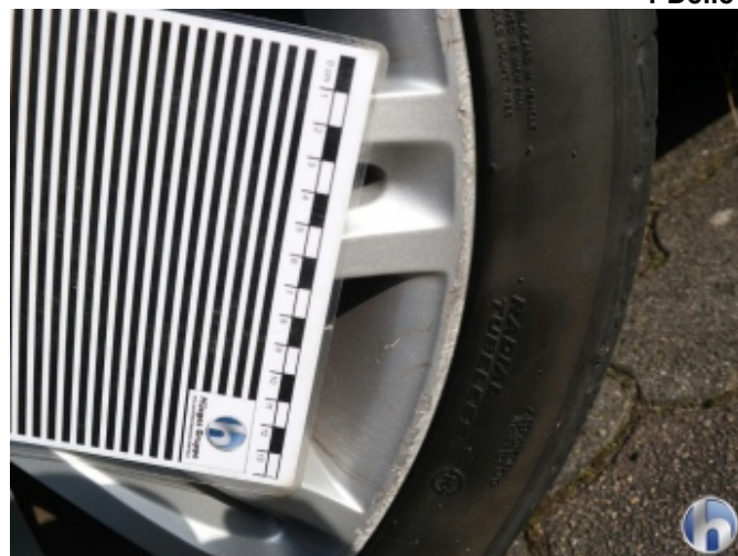
2. Felge (Aluminium) hinten rechts