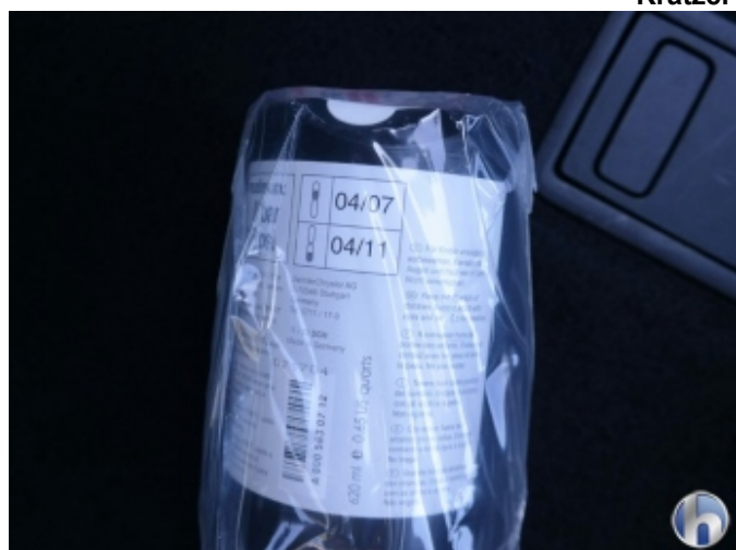
6. Tire-fit Füllmittel