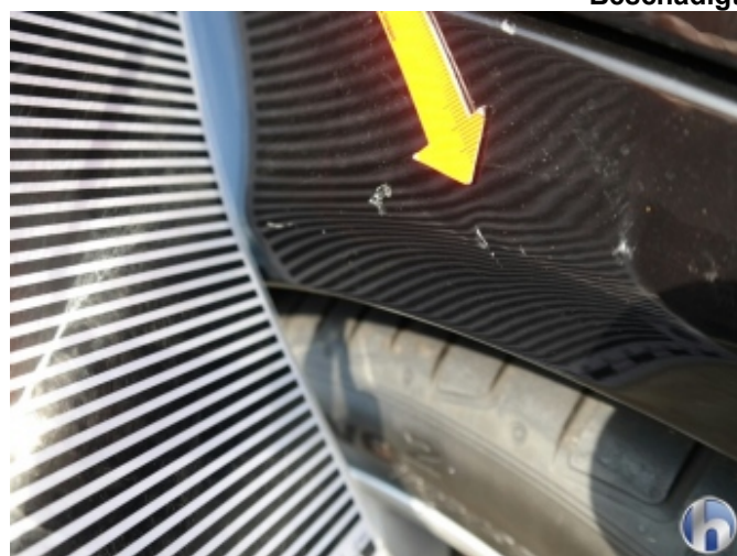
3. Seitenwand - Hinten - Rechts