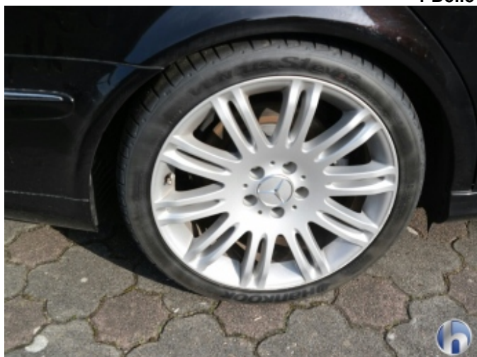
2. Felge (Aluminium) hinten rechts