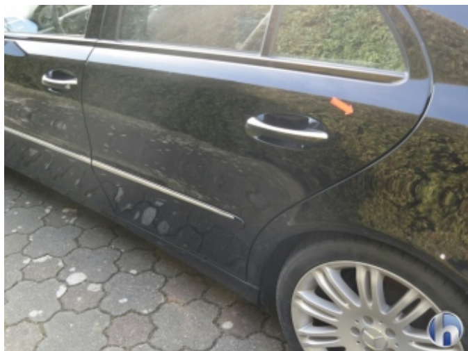
1. Tür Hinten - Links