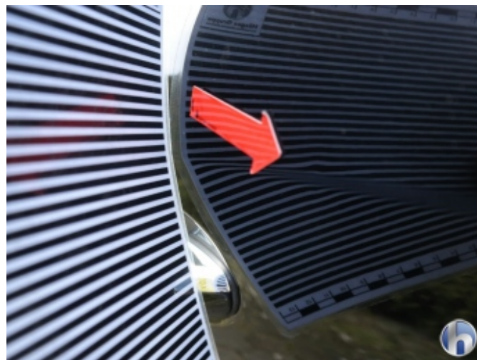
1. Tür Hinten - Links