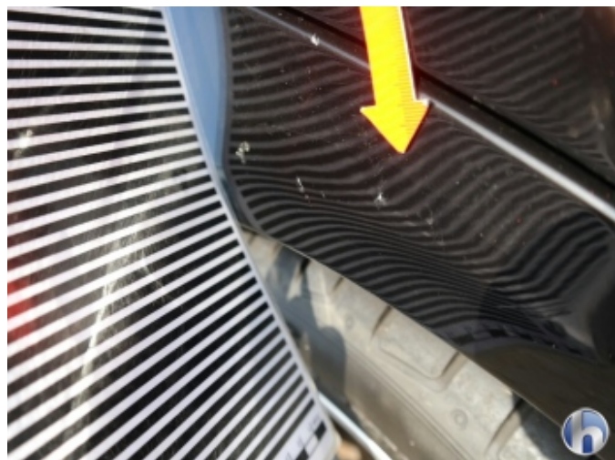
3. Seitenwand - Hinten - Rechts