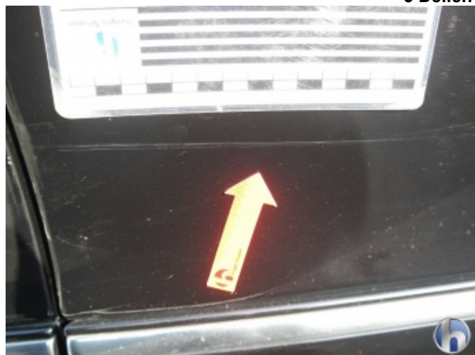
4. Tür Vorne - Rechts